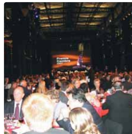
L'acte de lliurament es farà el 10 de juny /// c.sbd